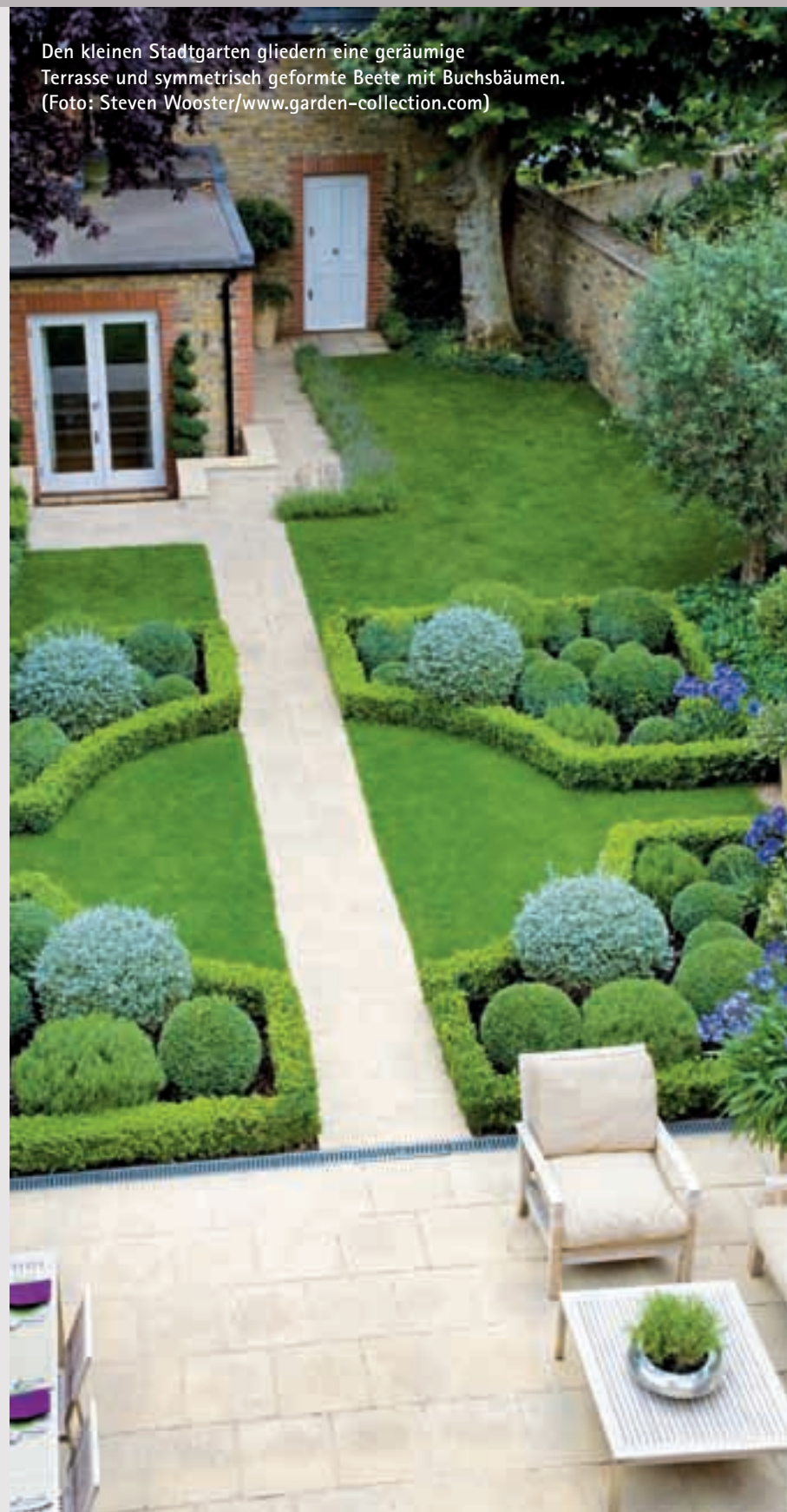
Den kleinen Stadtgarten gliedern eine geräumige Terrasse und symmetrisch geformte Beete mit Buchsbäumen.