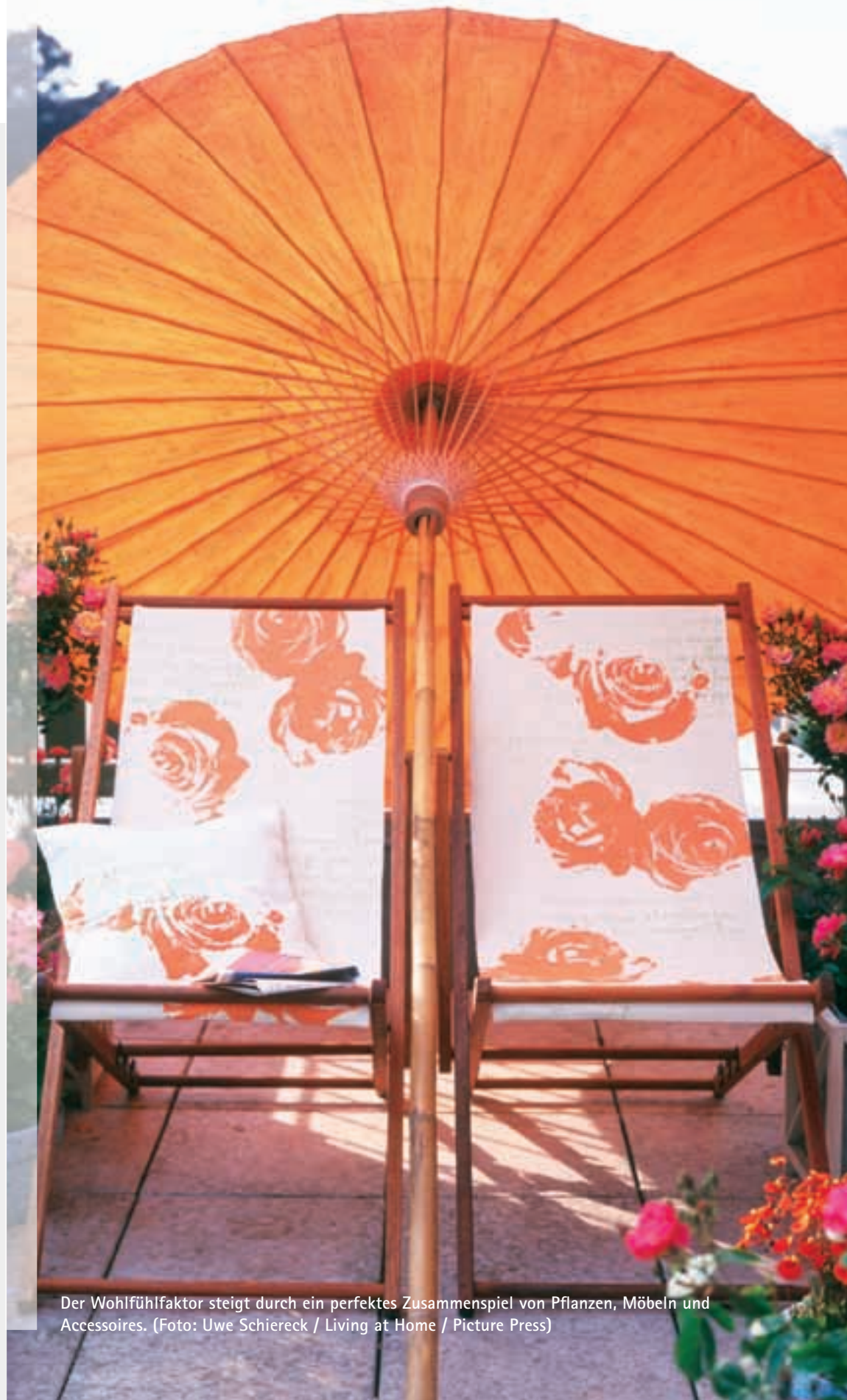
Der Wohlfühlfaktor steigt durch ein perfektes Zusammenspiel von Pflanzen, Möbeln und Accessoires.

Die Raumaufteilung ist natürlich in erster Linie Geschmackssache, meist empfiehlt es sich jedoch, sowohl auf der Terrasse als auch auf dem Balkon, die Pflanzen in den Randbereichen unterzubringen. Wer sich erst umständlich an seinen Sitzplatz schlängeln muss, bleibt sonst vielleicht doch lieber auf dem Wohnzimmersofa hängen. Auch sonst gilt: Der Wohlfühlfaktor steigt mit der Bewegungsfreiheit. Verzichten Sie im Zweifelsfall lieber auf einige Töpfe und wählen Sie Tisch und Stühle eine Nummer kleiner, anstatt bei jedem Schritt und jedem Stühlerücken Angst vor Scherben haben zu müssen.