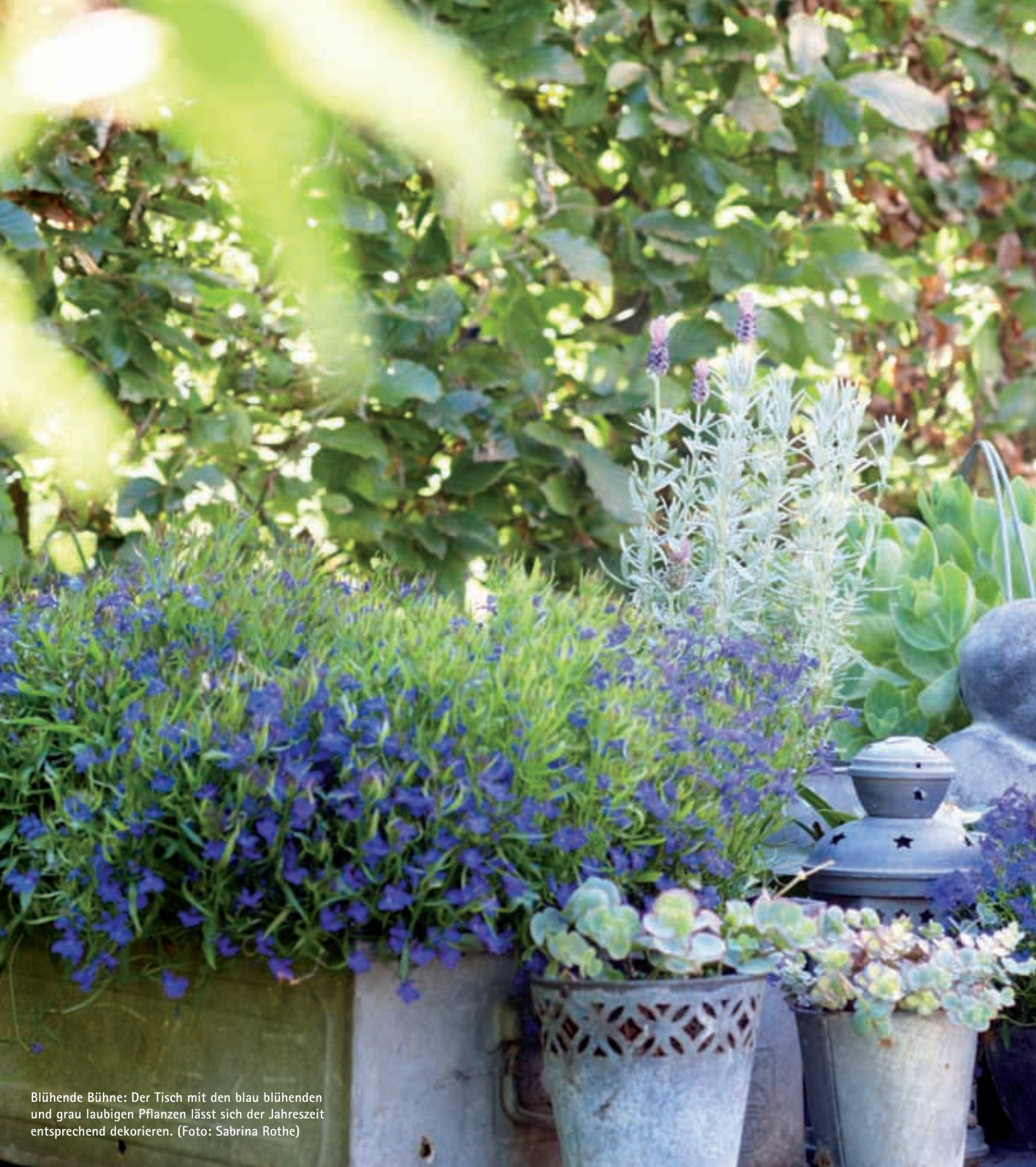
Blühende Bühne: Der Tisch mit den blau blühenden und grau laubigen Pflanzen lässt sich der Jahreszeit entsprechend dekorieren.