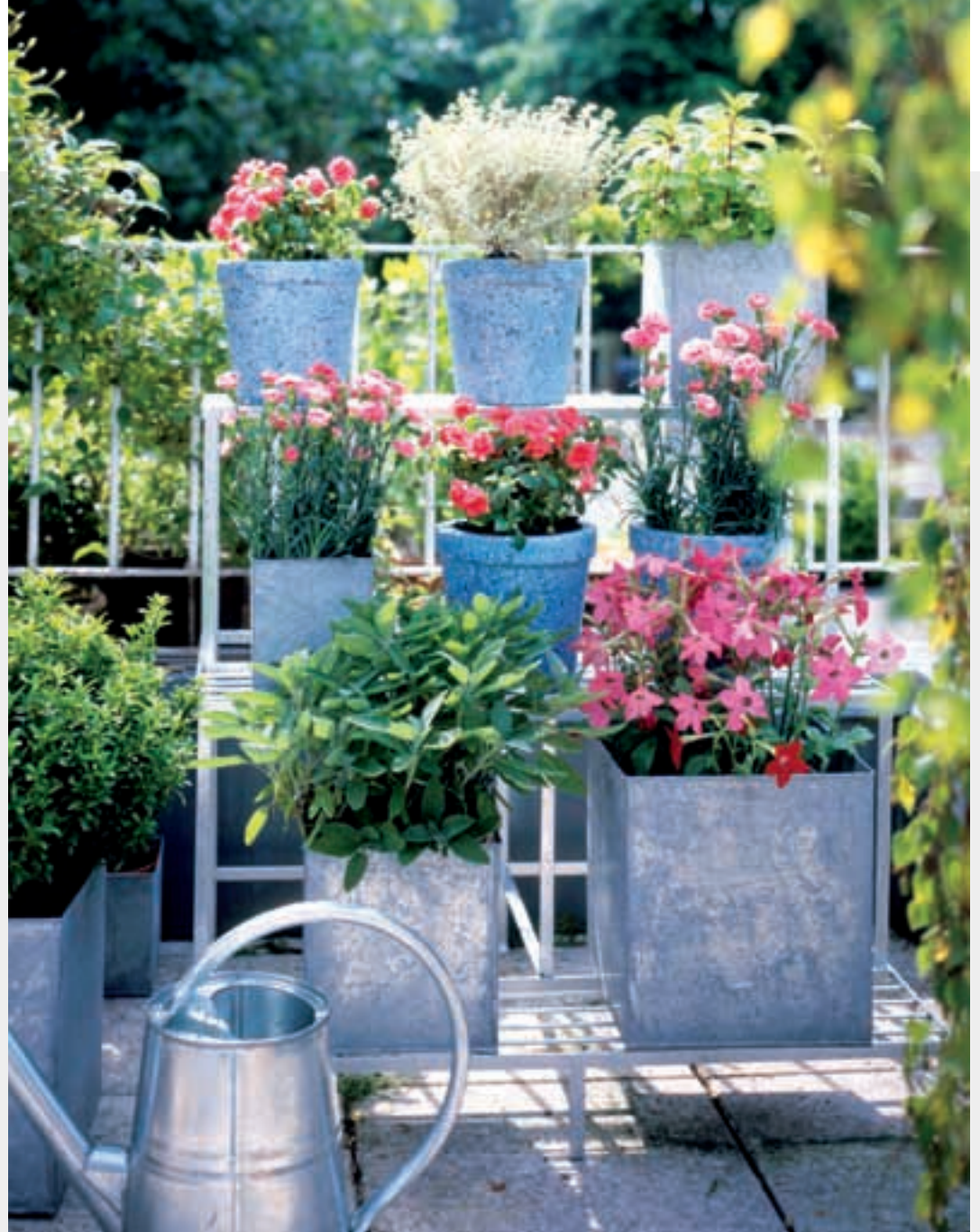
Mithilfe von Blumenetageren finden auf derselben Fläche mehr Töpfe Platz als auf dem Boden

Vielleicht träumen Sie schon lange davon, im sanften Licht der Morgensonne gemütlich frühstücken zu können, dann sollte sich der Balkon möglichst auf der Ostseite des Hauses befinden. Wenn Sie gern ein bisschen länger liegen bleiben und danach jede Minute zählt oder sich das Frühstück ohnehin auf eine schnelle Tasse Kaffee beschränkt, ist Ihnen